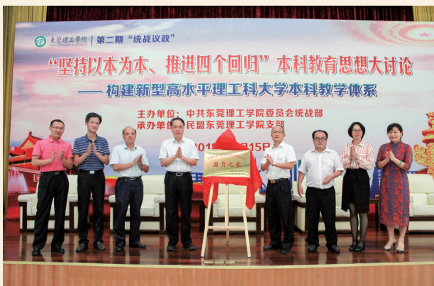
▲11月15日，民盟东莞理工学院支部盟员之家揭牌仪式在东莞理工学院学术交流中心举行。东莞市政协副主席、民盟东莞市委主委程发良，东莞理工学院党委副书记、校长李琳等参加了活动。