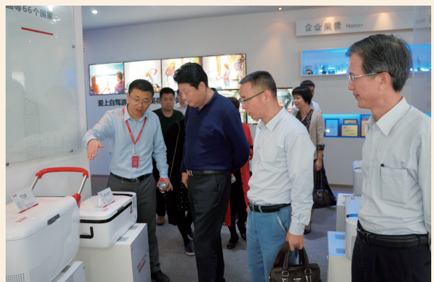
▲12月4日，民盟清远市委调研组到中山开展“践行新发展理念，推动清远高新区高质量发展”专题调研。