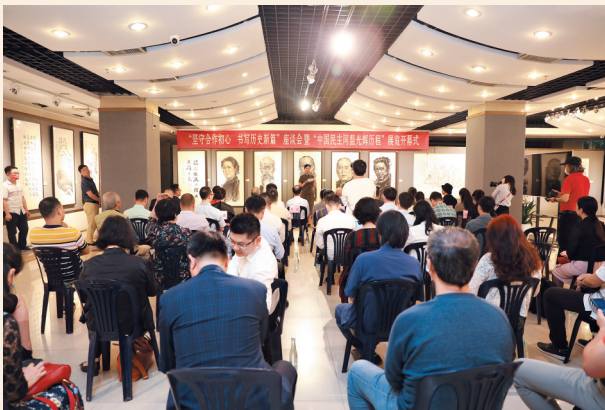
▲3月19日，民盟广州市委在越秀区文化艺术中心召开“坚守合作初心 书写历史新篇——纪念中国民主同盟成立八十周年暨广州民盟地方组织成立七十五周年”座谈会并举办“中国民主同盟光辉历程”展览开幕仪式。