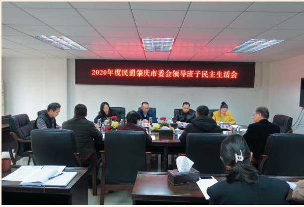
▲1月16日，民盟肇庆市委召开2020年度领导班子民主生活会，民盟广东省委专职副主委、监督委员会主任程昆，组织处处长杨扬应邀莅会指导。