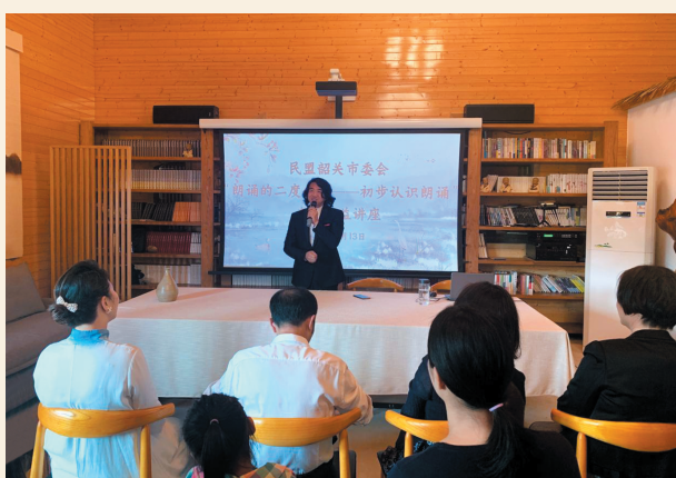
▲3月13日，民盟韶关市委会邀请盟员艺术家到韶关阅界民宿，举办主题为“朗诵的二度创作——初步认识朗诵”的公益讲座。