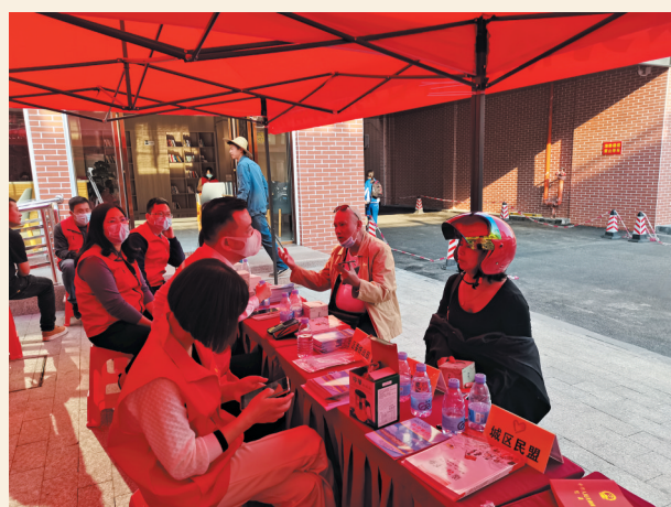
▲3月11日，民盟汕尾市委会“同心圆”志愿服务队在市城区党群服务中心举办法律咨询服务活动，为社区群众免费提供法律咨询服务，以实际行动助力城市基层党建工作。