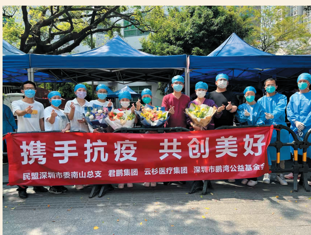
▲2月23日始，民盟福田三支部每天安排两名以上盟员义工赴莲花街道办社区核酸检测点支援。