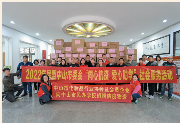
▲2月13日，民盟中山市委会携手市化妆品行业协会及爱心企业，为民办学校捐赠防疫口罩、消毒液等一批价值30余万元的防疫物资。