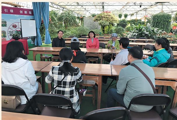
▲1月10日，民盟仲恺农业工程学院支部组织盟员赴广州花卉研究中心优质花卉示范基地（从化）开展调研。