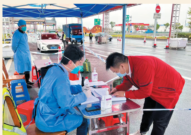
▲3月27日，民盟佛山市委会机关干部投入抗击疫情阻击战中，到高速路口收费站进行支援，协助相关部门开展中高风险来返佛山人员车辆排查管控。