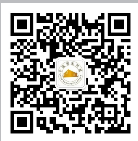
民盟广东省委微信公众号

总 编 辑：程 昆 副 总 编 辑：杨 扬 主 编：杨 菁 副 主 编：郑江林 责任编辑：王 祥 编 辑：李清翌 何 晶 崔寒俊