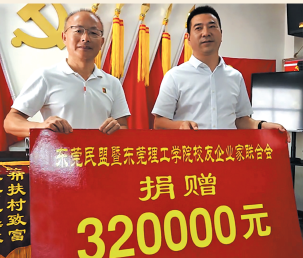
▲8月12日，东莞市政协副主席、民盟东莞市委主委程发良率盟员企业家一行赴湖北长阳土家族自治县开展乡村振兴帮扶活动。