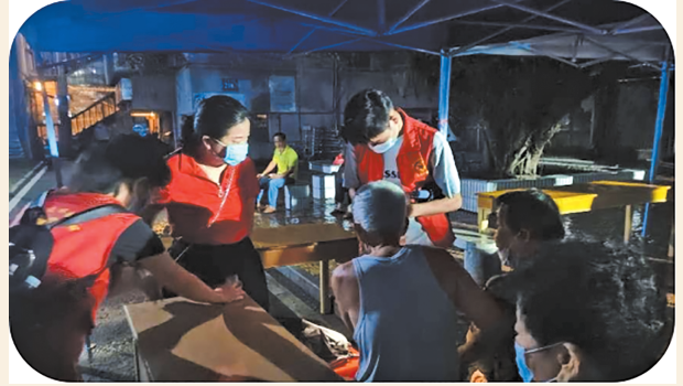
▲茂名“0708”疫情发生后，民盟茂名市委会积极发动广大盟员投身疫情防控工作。图为盟员教师在防疫志愿者服务点巡查核酸检测情况。