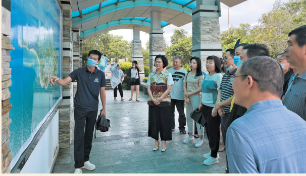
▲7月2日，民盟惠州市委会赴惠东县港口开展“矢志不渝跟党走、携手奋进新时代”政治交接主题教育暨“乡村振兴粤盟行”调研活动。