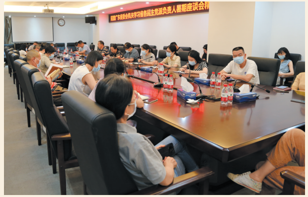
▲9月14日，民盟广东省委会机关召开专题学习会，学习贯彻2022年广东省各民主党派负责人暑期座谈会精神。