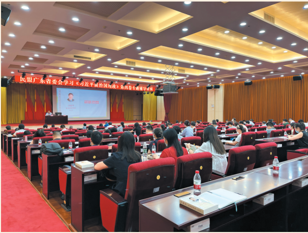
▲7月28日，民盟广东省委会在广州举办学习《习近平谈治国理政》第四卷专题辅导讲座。