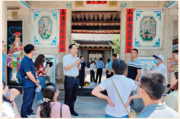
▲4月26日，民盟汕头市委会举办2022年新盟员培训班，围绕“矢志不渝跟党走、携手奋进新时代”政治交接主题教育这一中心内容，以现场教学、讲座交流等形式进行。