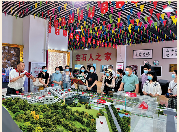
▲5月29日，民盟惠州市委会赴博罗县罗阳镇小金村四角楼珠宝创意园开展乡村产业发展调研活动。