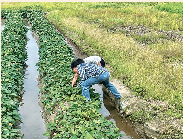
▲5月31日，民盟湛江市委会调研组到遂溪县草潭镇北灶尾村开展科技帮扶农业调研。