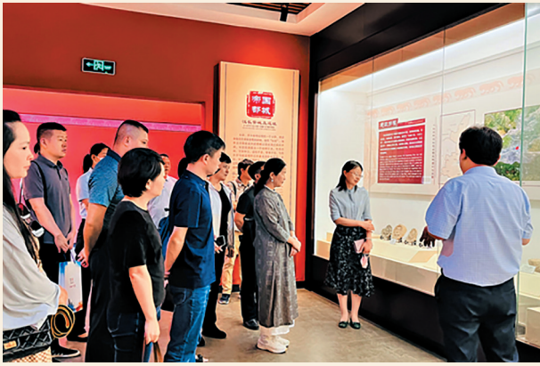
▲6月14日，民盟广州市委会调研组以陕西博物馆改革发展总体思路、文博系统产业现状和文博产业发展过程遇到的瓶颈问题及解决思路为主题，赴陕西开展调研。