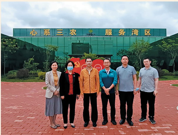
▲5月16日，民盟韶关市委会调研组围绕“改革创新，依托优质农产品优势，大力发展预制菜产业”课题赴惠州、深圳、佛山等地开展调研。