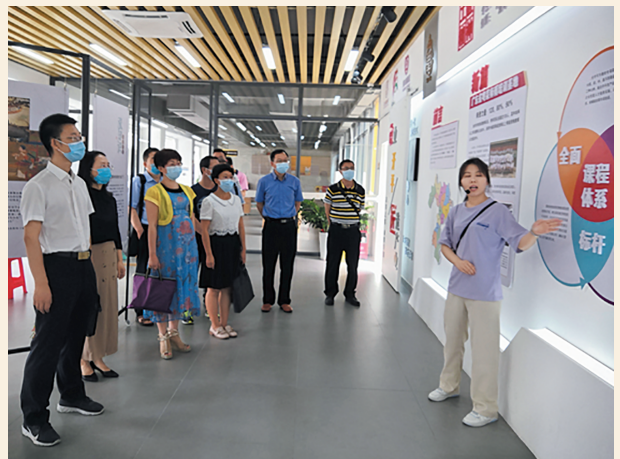
▲5月19日，民盟开平市委会调研组一行分别赴市人社局、市教育局及相关学校开展职业教育专题调研。