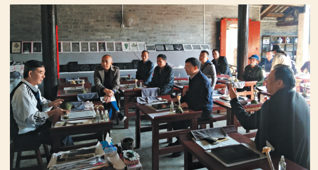
▲11月27日，民盟河源市基层委员会赴梅州开展乡村振兴与乡村文旅融合发展调研活动。