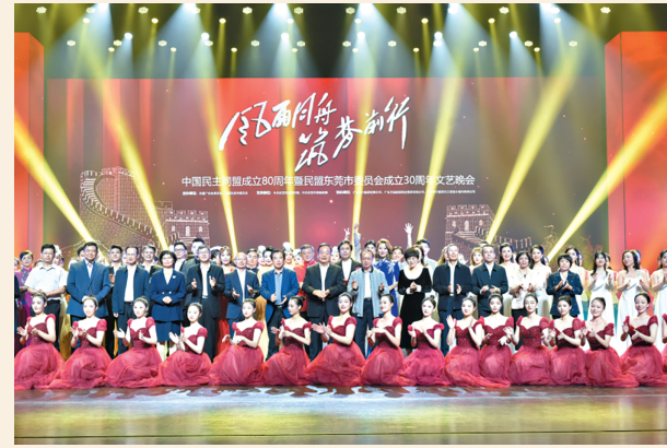
▲11月15日晚，由民盟广东省委会、民盟东莞市委会主办的“风雨同舟 筑梦前行”庆祝中国民主同盟成立80周年暨民盟东莞市委员会成立30周年文艺晚会和图片展在东莞隆重举行。民盟广东省委会主委王学成，副主委程昆、汪华侨出席晚会。