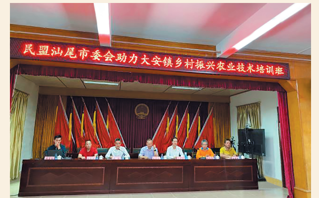
▲10月30日，民盟汕尾市委与民盟广东省农科院总支在汕尾市城区举行签约仪式，帮助基层培训农业技术人才、为农企农户提供农业技术服务。