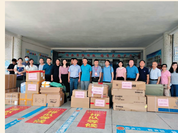
▲9月24日，民盟中山大学南校区总支与广东省广建设计集团有限公司一起赴清远开展“助力清远扶持乡村教育”活动。