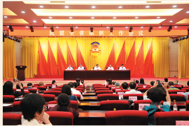
▲9月25日，民盟全省组织工作会议在广州召开。广东省人大常委会副主任、民盟广东省委主委王学成，民盟广东省委副主委程昆、邓文基、张志兵、汪华侨出席会议。