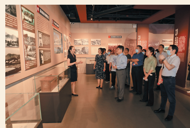
▲8月20日，民盟深圳市委赴龙华区中国文化名人大营救纪念馆开展中共党史学习教育现场教学活动。