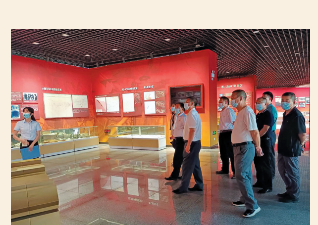
▲9月17日，民盟韶关市翁源县文化支部、中医院支部联合开展中共党史学习教育及读书分享活动。