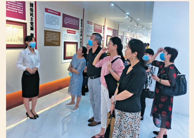
▲7月9日下午，民盟广州市委组织机关干部到白云区嘉禾街“红旗坊”红色历史展馆开展现场党史学习教育。